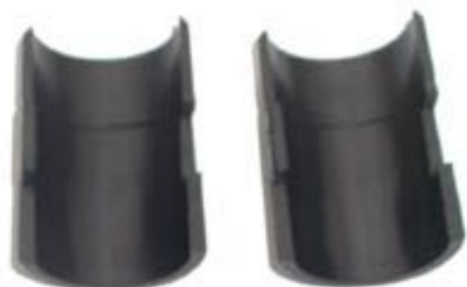
plastové objímky (pár)

Plastové objímky (a tím i police) lze uchytit na stojině regálu v rastru 25 mm